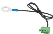
Connecteur avec un câble négatif CC préassemblé (inclus)