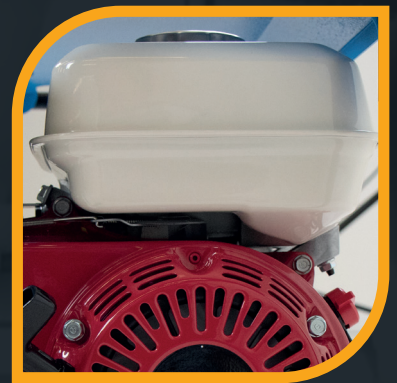
Serbatoio da 3,1 Lt