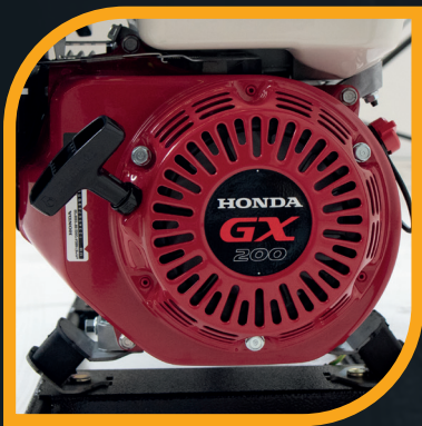
Motore Honda GX 200